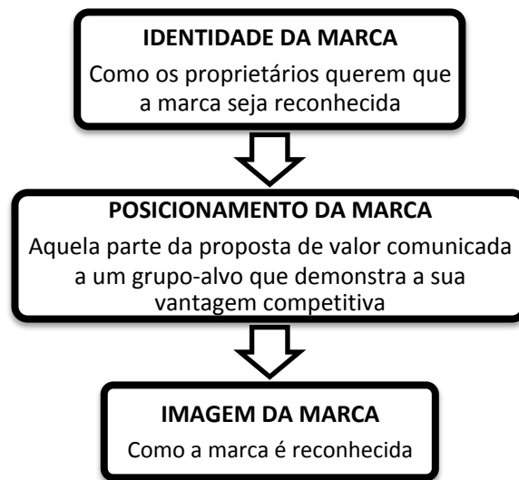
Figura 2. Interconexão da identidade, posicionamento e imagem de marca